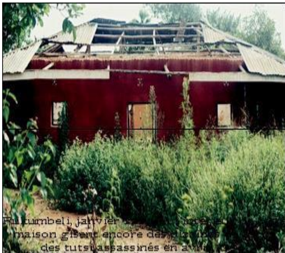
Photo du site de la chapelle située près de la maison de Osée Gasasira

leurs tueries à la chapelle de chez Osée Gasarasi. Ils ont d'abord sorti Osée Gasarasi et l'ont découpé en deux avant de commencer de massacrer jusqu'à 7h du soir les Tutsi qui s'étaient réfugiés dans la chapelle. Le lendemain matin, les Interahamwe ont apporté du piment en poudre et en aspergèrent leurs victimes. Ceux qui étaient encore en vie, soit éternaient, soit gémissaient de douleur ; ainsi débusqués, ils furent tous achevés 542 .